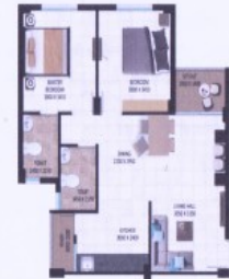
2 BHK - यूनिट प्लान