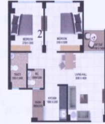
2 BHK - यूनिट प्लान