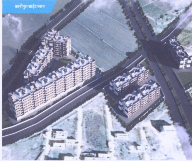
कानीपुरा साईट प्लान